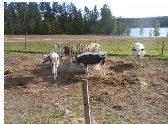
Kor med utsikt över Bursjön.