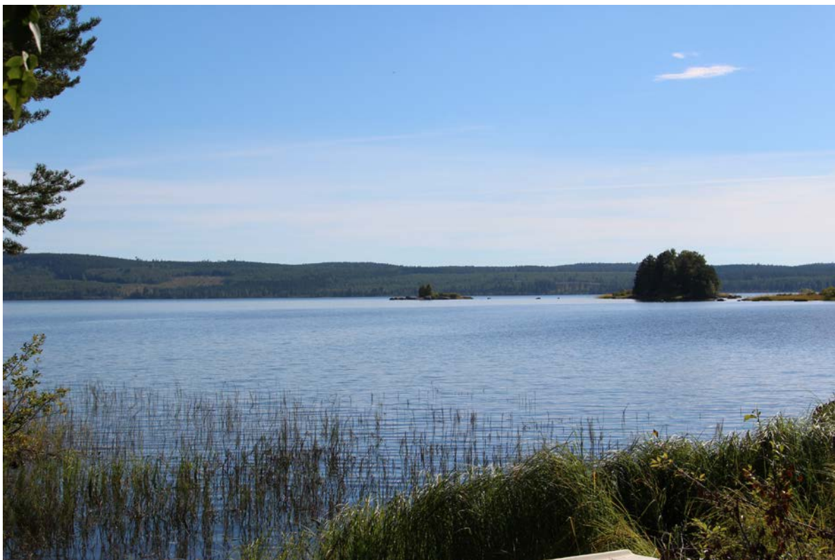
Utsikt över Galvsjön.