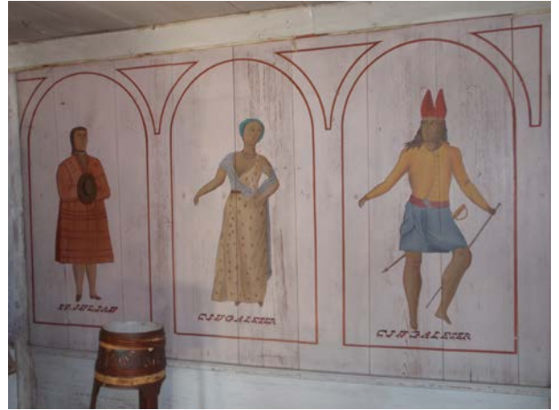
Cingaleser m.m.