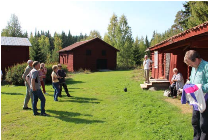
Slåtta Vallvaktargård.

Efter lunchen fanns det möjlighet för den som ville och hade möjlighet att berika sig ytterligare att ta vägen hem förbi Slåtta vallvaktargård i Ovanåker där Åke Holmsgård guidade. Gonaker, janitscharer, cingaleser och andra människor från olika håll i världen kunde beskådas på de unika väggmålningarna.