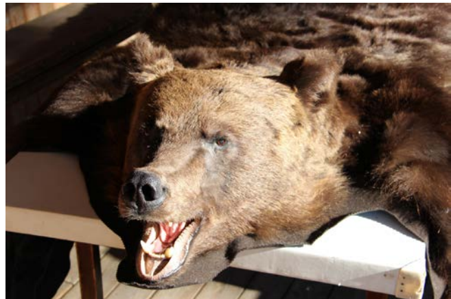
Björn skjuten i Hästberg.