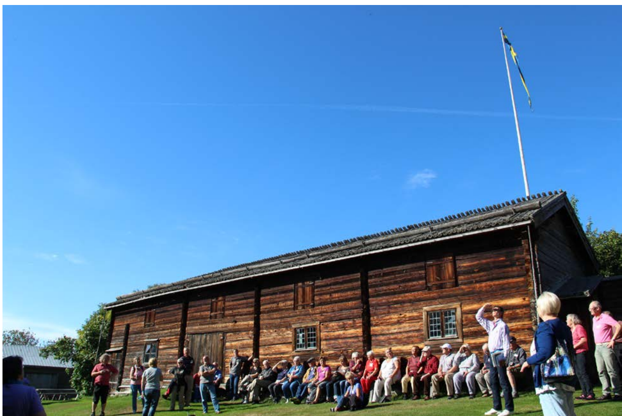
Karlsgården.