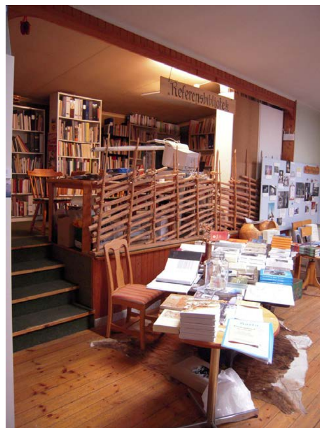
"Gamla Finnskogsmuseet".